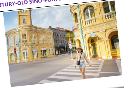
CENTURY-OLD SINO-PORTUGUESE BUILDING