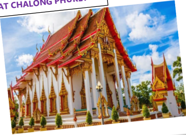
WAT CHALONG PHUKET