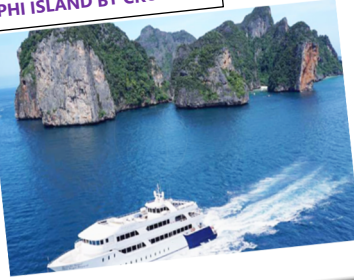
PHI PHI ISLAND BY CRUISE